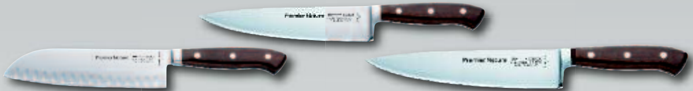
Santoku-Messer mit Kullenschliff, 18 cm, 8144218H

– Jedes Messer ein Unikat mit ergonomischem Holzgriff aus Grenadill.