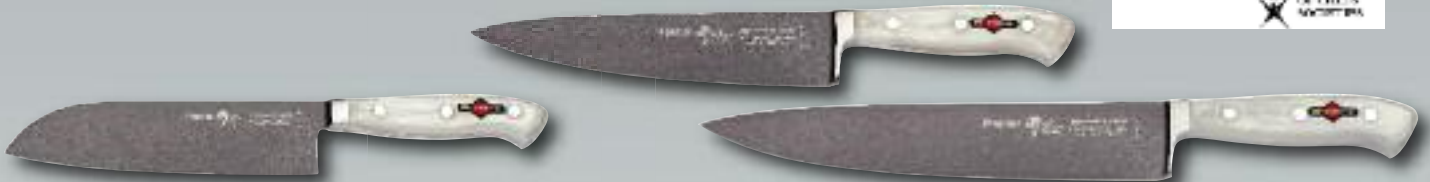
Santoku-Messer, 18 cm, 8144218B

1358 5921 1 St 46,22/ 55,00 Netto / inkl. MwSt.