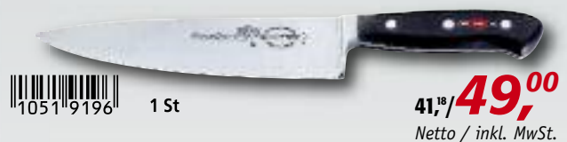
Kochmesser, 21 cm, 8144721

1051 9196 1 St 41,18/ 49,00 Netto / inkl. MwSt.