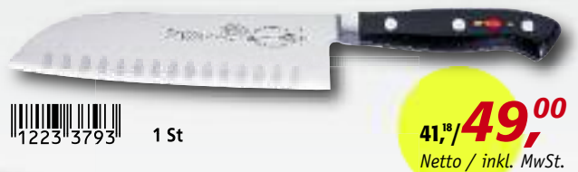
Santoku-Messer mit Kullenschliff, 18 cm, 8144218 K

1223 3793 1 St 41,18/ 49,00 Netto / inkl. MwSt.