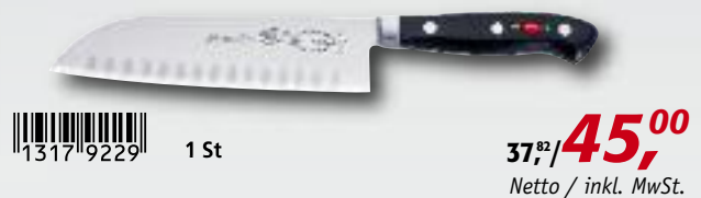
Santoku-Messer mit Kullenschliff, 14 cm, 8144214 K

1317 9229 1 St 37,82/ 45,00 Netto / inkl. MwSt.