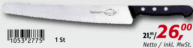
Universalmesser, 26 cm, 8115126

1053 2775 1 St 21,85/ 26,00 Netto / inkl. MwSt.