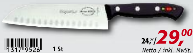
Santokumesser mit Kullenschliff, 18 cm, 8444218K

1317 9526 1 St 24,37/ 29,00 Netto / inkl. MwSt.